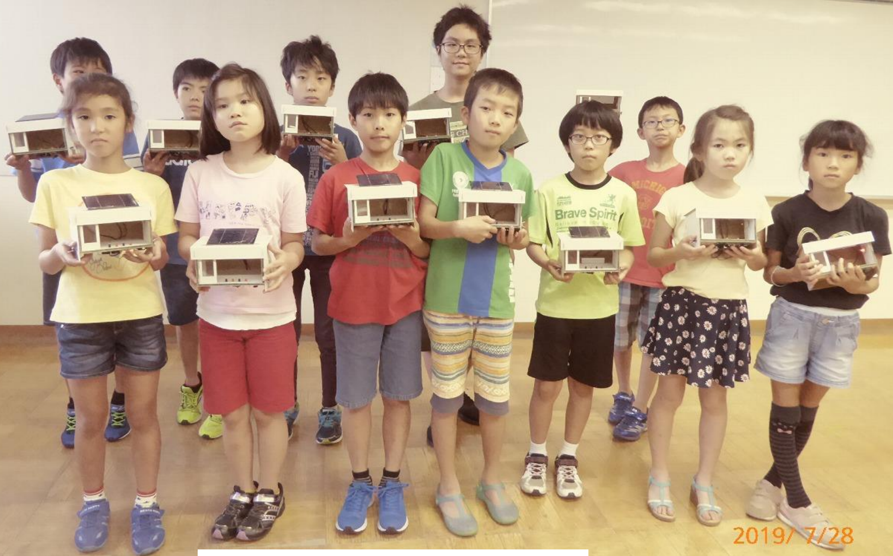
出来上がったお店型ハウスを持って