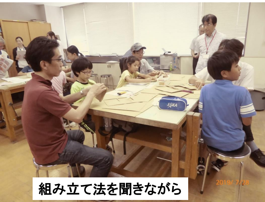
組み立て法を聞きながら