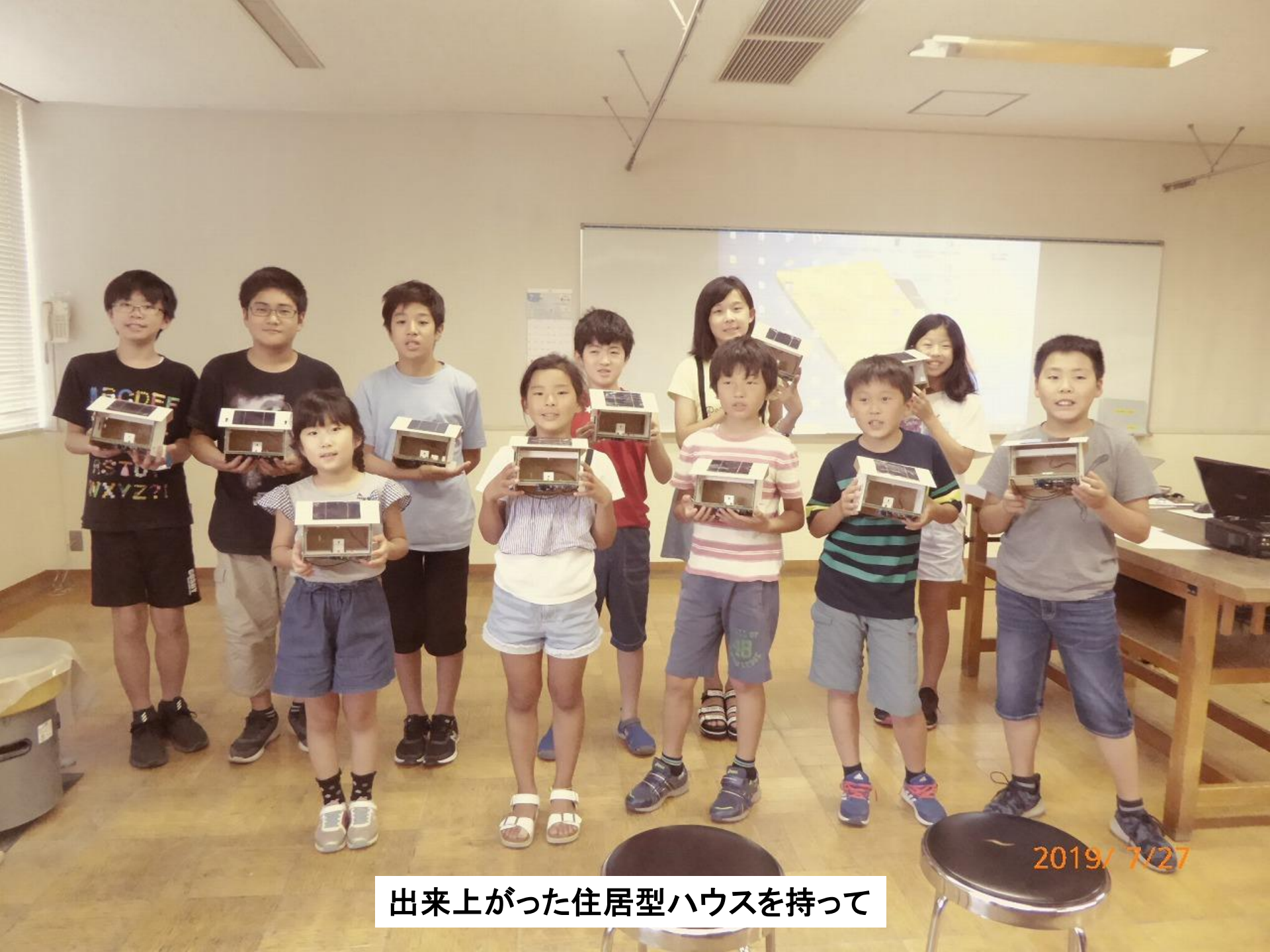
出来上がった住居型ハウスを持って