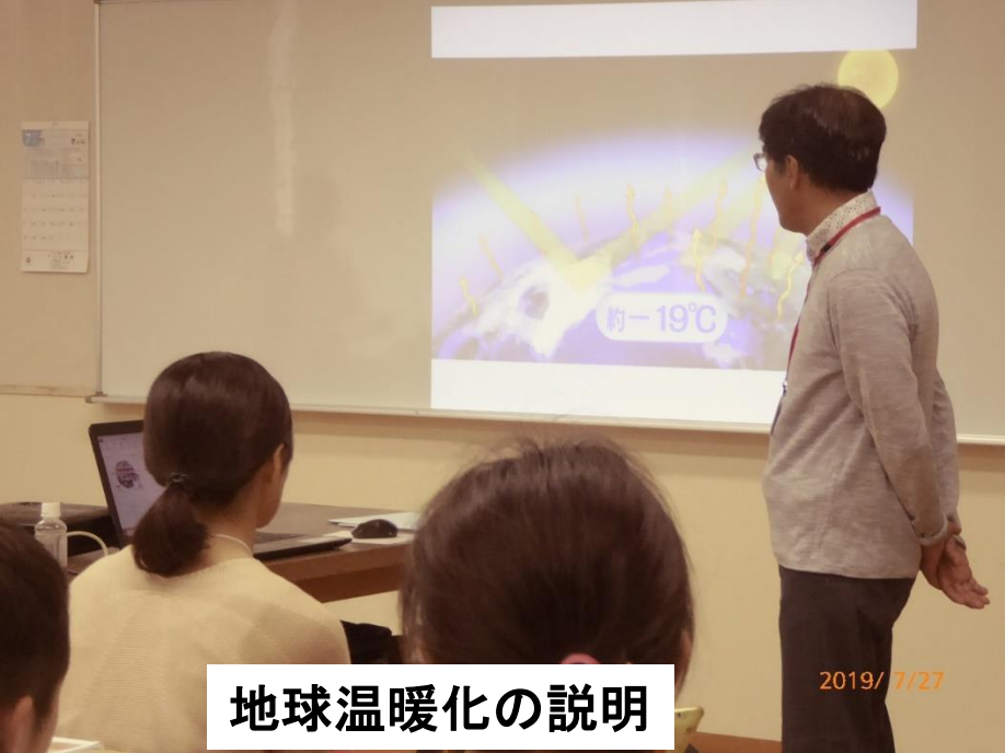
地球温暖化の説明